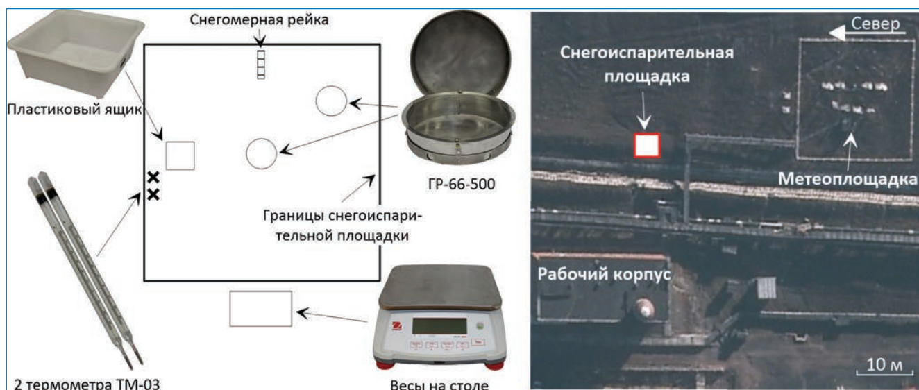
Схема размещения снегоиспарительной площадки и ее наполнения

ственным снежным покровом. В качестве испарителей выступали стандартные снежные испарители ГГИ-500-6 (ГР-66) и пластиковый ящик, выполненный из морозостойкого пластика, одного из наиболее близких по теплоемкости и теплопроводности к снежному покрову материалов. Взвешивание монолитов происходило на морозостойких весах в ветрозащищенном месте. Параллельно со взвешиванием производился отсчет высоты снежного покрова на площадке и измерение температуры поверхности снежного покрова. По результатам наблюдений составлялась месячная таблица суточных сумм испарений и данных метеонаблюдений. Обработка результатов, согласно методике, подразумевает также расчет испарения при пропуске, невозможности выполнения или некачественных измерений в срок. Восстановление пропусков наблюдений за испарением происходит на основании полученных данных.