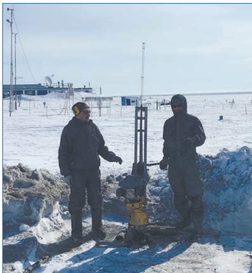
Бурение на метеостанции МГ-2 о. Врангеля

На большей части трансекты бурение термометрических скважин выполнено впервые, и впервые получены данные о температурном режиме грунтов (на геофизиологической карте СССР температурная характеристика мерзлоты арктических архипелагов была дана исходя из теоретических предпосылок по данным о температурах воздуха с метеостанций). Сравнительный анализ данных по скважинам показывает, что на Шпицбергене велико влияние атлантических океанических и атмосферных масс — температура на подошве слоя годовых теплооборотов составляет все-