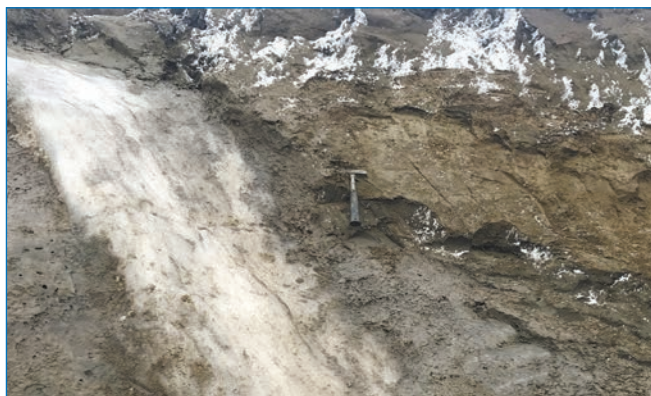
Повторно-жильный лед в обнажении на о. Визе (см. геологический молоток для масштаба)

тальное обследование береговых обнажений высотой 8–10 м показало, что в толщах мерзлых нижнемеловых горизонтально-слоистых песков встречаются стяжения сферической формы до 3–4 м в диаметре, а также протяженные пласты мощностью 0,2–0,8 м известково-кремнистых песчаников. Пляжи слагаются галькой этих плотных пород. На поверхности можно наблюдать россыпи каменного материала, выпученного мерзлотой. Со второй попытки (первая скважина уперлась в скальный грунт на глубине около 4 м) была пробурена термометрическая скважина глубиной 25 м по пескам с массивной криотекстурой. На ровной поверхности без каменного материала размечена площадка мониторинга СТС. В обнажениях и шурфах были исследованы и отобраны образцы ПЖЛ. Несмотря на то, что обрывы с ледяными жилами на о. Визе во многом напоминают классические плейстоценовые обнажения с остатками мамонтовой фауны, здесь мы имеем дело с так называемыми эпигенетически промерзшими отложениями. Сами осадки образовались около 100 млн лет назад в эпоху с теплым