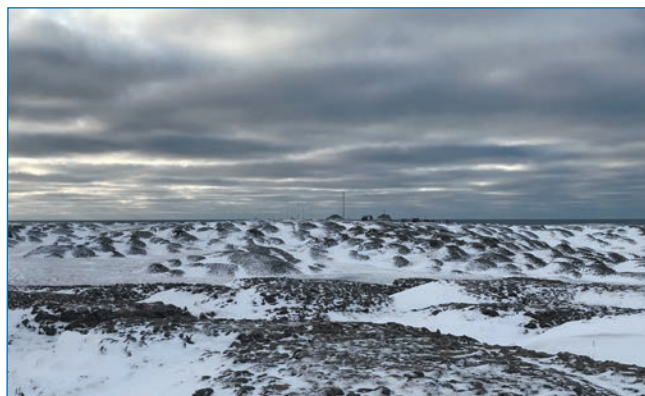
Образованные мерзлотой конические холмы — байджарахи. Строения на заднем плане — метеостанция МГ-2 Пролив Санникова (о. Котельный, арх. Новосибирские острова)

Архипелаг Новосибирские острова. В августе 2023 года НЭС «Михаил Сомов» встало на незапланированный ремонт, и функции снабженческого рейса по полярным станциям легли на НЭС «Академик Трёшников». Было принято оперативное решение использовать этот рейс для организации еще одного пункта мониторинга и перебазировать отряд мерзлотоведов с о. Визе на Новосибирские острова. На этом архипелаге есть три действующие метеорологические станции: АЭ Котельный, МГ-2 Пролив Санникова и МГ-2 Кигилях. Необходимо было выбрать для работ одну из них с точки зрения пригодности для расположения здесь пункта мониторинга мерзлоты. Помимо анализа картографического материала и космоснимков в этом вопросе в некоторой степени помогла книга А.Ф. Трёшникова «Мои полярные путешествия», хранящаяся в судовой библиотеке. А.Ф. Трёшников перед войной участвовал в экспедиции Арктического института,