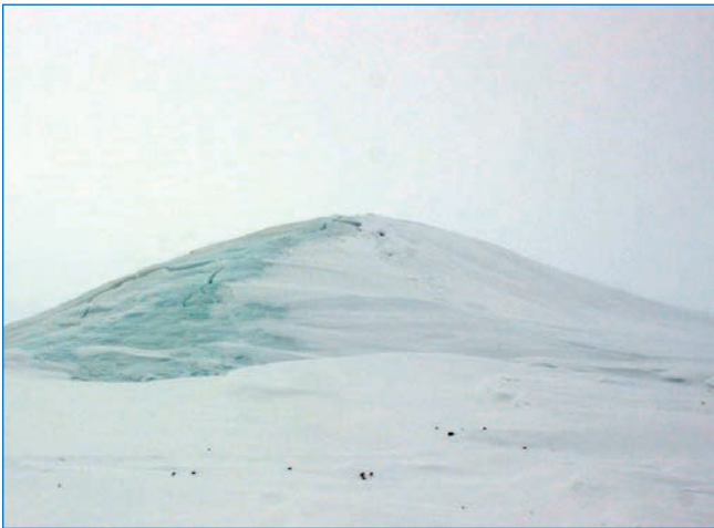
Наледный бугор — блистер в устьевой зоне р. Новая (арх. Северная Земля)

характеристика криолитологического строения морских, аллювиальных и элювиальных отложений. Одна из скважин бурилась с припайного льда и под толщей морской воды вскрыла донные льдосодержащие грунты.