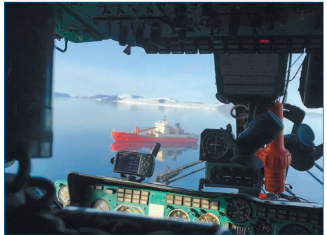
НЭС «Академик Трёшников» в проливах Земли Франца-Иосифа

В 2022 году ААНИИ был определен исполнителем масштабного проекта создания Государственной системы фоновго мониторинга состояния многолетней мерзлоты (ГСМ СММ). При разработке РД 52.17.925–2023 «Руководство по организации и осуществлению государственного фоновго мониторинга состояния многолетней мерзлоты» был учтен опыт, полученный ранее на Шпицбергене и Северной Земле. Проект предусматривает создание 140 пунктов мониторинга на территории Российской Федерации. Каждый пункт мониторинга оборудуется термометрической скважиной. Часть скважин, в высокоширотной Арктике, ААНИИ выполняет собственными силами, остальные — с привлечением сторонних организаций.