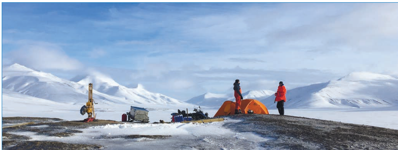
Бурение скважины на гидролакколите Нори в долине Грёндален (арх. Шпицберген)

диссертация «Формирование и современная динамика гидролакколитов архипелага Шпицберген».