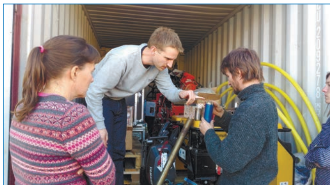
Бурение скважины в устьевой зоне р. Новая (арх. Северная Земля)

применения различных видов буровых коронок для проходки мерзлых пород в университете UNIS, Лонгйир