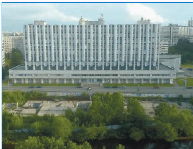
Новое здание ААНИИ на ул. Беринга.

21 июня 1983 года В.Я. Ходырев был избран председателем Ленгорисполкома, став высокопрофессиональным главой огромного и сложного хозяйства нашего уникального и самого красивого в мире города. В период его руководства были построены восемь станций метрополитена, новый аэровокзальный комплекс «Пулково-2», сдан в эксплуатацию комплекс защиты города от наводнений и здание учебных корпусов, служебных и жилых помещений Ленинградского государственного университета в Новом Петергофе.