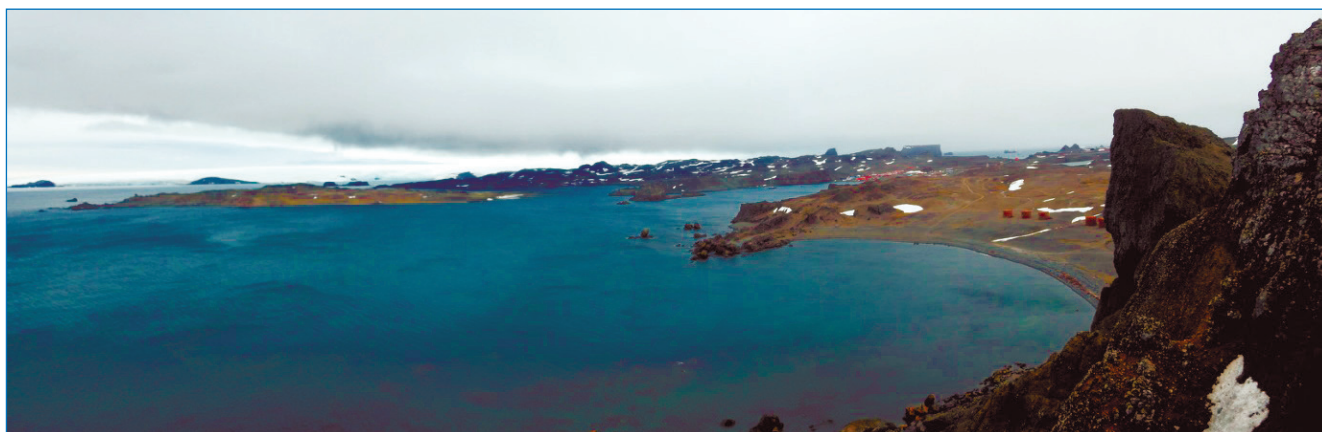
Рис. 4. Панорама бухты Ардли (на ее берегу находятся станции Беллинсгаузен (Россия) и Эдуардо Фрей (Чили)) и бухты Каменистая (с расположением российской нефтебазы постройки 1970-х годов). 4 февраля 2024 года