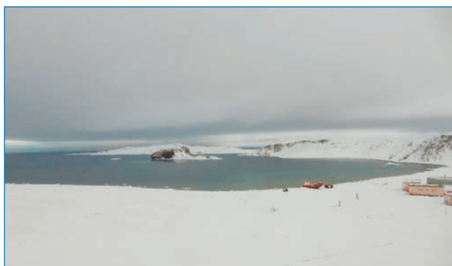
Рис. 3. Фото аномального зимнего состояния бухты Ардли без ледяного покрова. 28 августа 2023 года