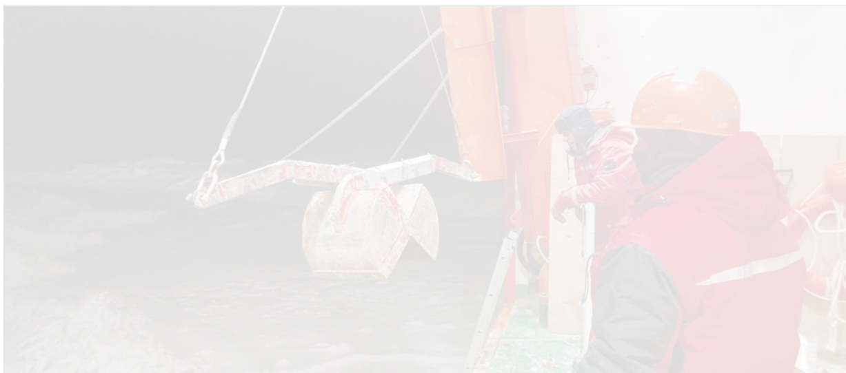
Работа с дночерпателем «Океан» с борта НЭС «Северный полюс»

рактором грунтов и в равной степени промерзанием грунта в трубе при манипуляциях по ее подъему и перемещению на площадку отбора.