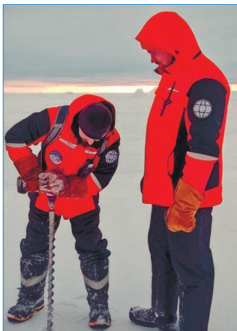
Рис. 7. Измерения толщины льда (слева) и постановка буя-маркера (справа) в ходе обследования ледяных полей при выполнении воздушной разведки 11 сентября

После завершения швартовых операций вертолет вылетел для подбора буя-маркера, установленного на резервном ледяном поле. С НЭС «Академик Трёшников», также пришвартовавшегося к новой базовой льдине СП-42, была протянута шланголиния длиной около 300 м для передачи запаса дизтоплива на НЭС «Северный полюс». С использованием вертолета на лед по предварительно выполненной разметке выставили крупногабаритные элементы инфраструктуры ледового лагеря — магнитный павильон, домики ПДКО метеолаборатории и океанографического терминала (рис. 9).