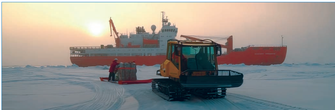
Рис. 5. Транспортировка палет с продуктами от НЭС «Академик Трёшников» на санях-волокушах

7 сентября с НИС «Ледовая база Мыс Баранова» прибыл вертолет АО «КрасАвиа» Ми-8МТВ-1 и был задействован в погрузочных операциях. С его помощью переместили несколько контейнеров с грузами как с НЭС «Академик Трёшников» на НЭС «Северный полюс», так и обратно. В перерыве между двумя сессиями работы с подвеской вертолет отставивался на размеченной на льду площадке.