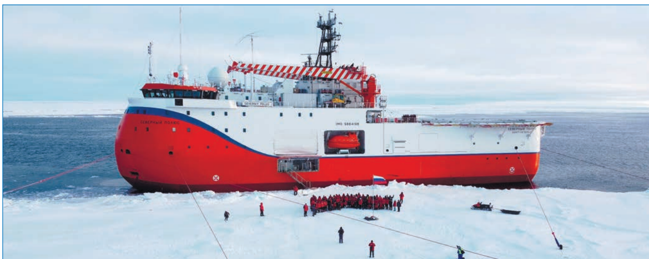
Рис. 10. Подъем флага Российской Федерации в новом ледовом лагере дрейфующей станции «Северный полюс-42»

К.В. Фильчук, М.А. Емелина (ААНИИ).