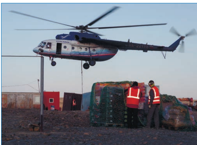
Рис. 3. Работы с участием вертолета Ми-8МТВ АО «КрасАвиа» на НИС

27 августа погодные условия улучшились и позволили НЭС «Академик Трёшников» повторно подойти к нефтебазе для отдачи остатков дизельного топлива. В тот же день на плавсредстве на НИС прибыли еще шесть человек сменного зимовочного состава, а на судно отправились 13 специалистов, которым предстояло возвращение в Санкт-Петербург. НЭС «Академик Трёшников» продолжило свое плавание и направилось в район дрейфа СП-42.