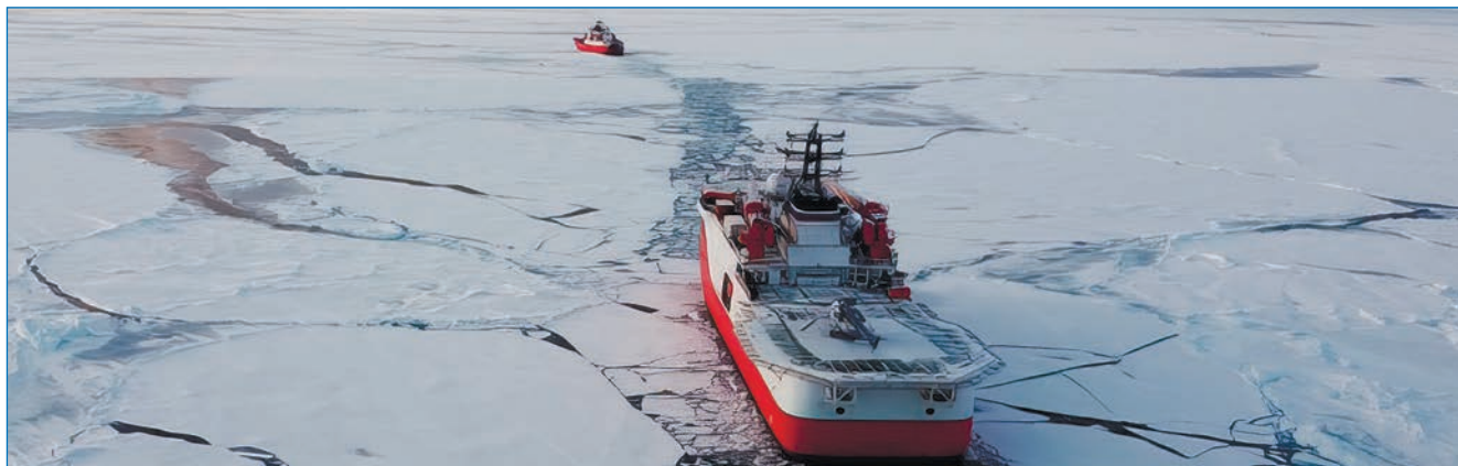
Рис. 6. Следование НЭС «Северный полюс» в канале за лидером

В ходе экспедиции в отделе флота института в качестве конечного пункта проводки предложили точку с координатами 87°10' с. ш. 110°00' в. д. Прокладку маршрута оперативно осуществила группа специального гидрометеорологического обслуживания экспедиции. Уже в первые часы операции по передислокации стало ясно, что суда в режиме проводки двигаются успешно, поэтому было решено перевести НЭС «Северный полюс» за НЭС «Академик Трёшников» (рис. 6) на 270 морских миль к западу.