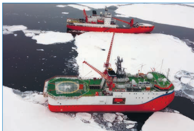
Рис. 4. Суда экспедиции, пришвартованные к остатку базового поля СП-42

4 сентября НЭС «Академик Трёшников» подошло к месту дрейфа станции (в координатах 87°18' с. ш. 144°37' з. д.). Базовое поле СП-42, к которому было пришвартовано НЭС «Северный полюс», в это время представляло собой ледяной фрагмент в форме квадрата со скругленными углами размерами 150×150 м. Специалисты СП-42 по результатам контактных измерений определили значения толщины льда в интервале от 1,5 до 2,5 м по всей площади фрагмента, за исключением локальных участков, где начали замерзать снежицы. Руководство экспедиции приняло решение осуществить переброску грузов и смену составов через лед, до перестановки НЭС «Северный полюс» к новому базовому полю. При этом остаток базового поля СП-42 стал маневровой площадкой. НЭС «Академик Трёшников» пришвартовалось к ледяному фрагменту со стороны, противоположной месту швартовки дрейфующего судна (рис. 4).