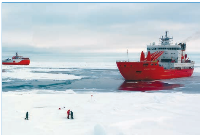
Рис. 8. Подход НЭС «Северный полюс» под проводкой НЭС «Академик Трёшников» к размеченному причалу