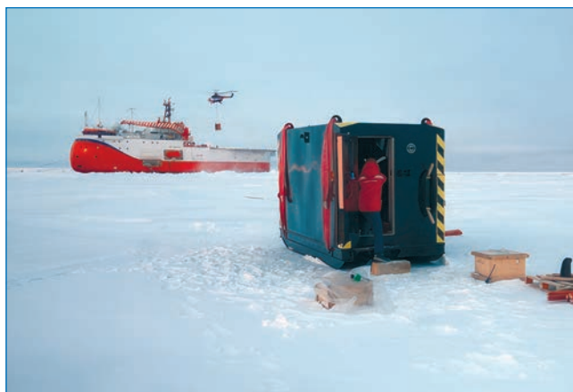
Рис. 9. Работы вертолета с подвеской по выгрузке крупногабаритных элементов инфраструктуры ледового лагеря

После завершения разгрузочных операций 13 сентября вертолет АО «КрасАвиа» Ми-8МТВ-1 вылетел на НИС «Ледовая база Мыс Баранова», куда благополучно прибыл после 6-часового перелета на следующий день.