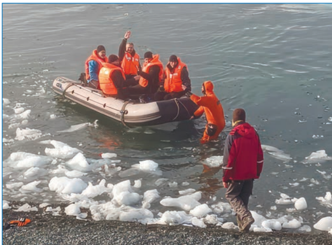
Рис. 2. Доставка сменного состава НИС «Ледовая база Мыс Баранова» при помощи маломерного плавсредства

В тот же день прибыл вертолет Ми-8МТВ АО «КрасАвиа» для проведения погрузо-разгрузочных работ с НЭС «Академик Трёшников» и осуществления ротации экипажа вертолета Ми-8, дежурящего в режиме 24/7 в системе поисково-спасательного обеспечения полетов Красноярской зоны авиационно-космического поиска и спасения (ПСОП). Эти работы продолжались и в последующие два дня. Вертолет перебрасывал снабжение нового зимовочного состава с НЭС «Академик Трёшников» на заранее подготовленные площадки НИС «Ледовая база Мыс Баранова» (рис. 3), а оттуда на борт судна перемещал грузы, которые предстояло доставить обратно в Санкт-Петербург. Ухудшение погодных условий 26 августа привело к перерыву в отдаче топлива с судна, которое вернулось на рейд.